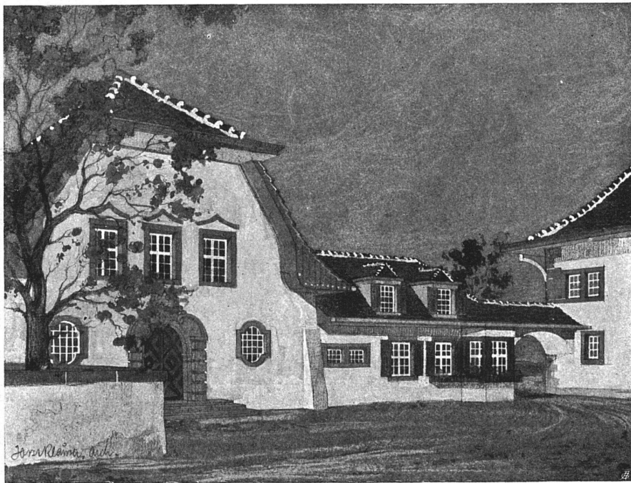
Schulhäuser für Tavannes