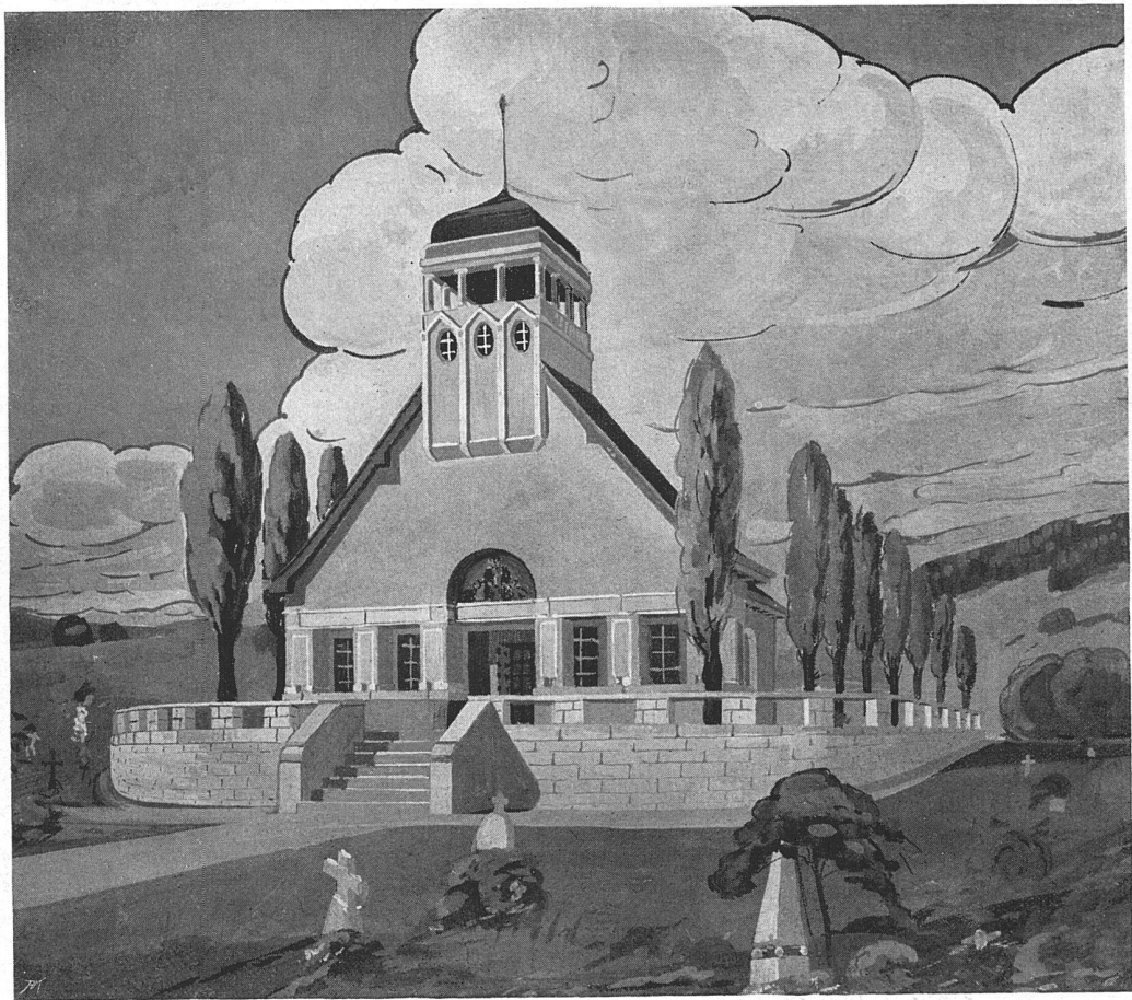
Kapelle für Fällanden bei Zürich, auf dem Friedhof

Architekten Sollinger & Kufner, Zürich II. — Nach einer Perspektive in Tempera