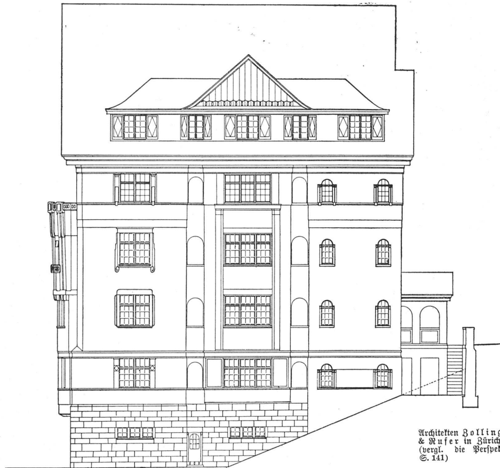
Miethaus an der Kirchbergstrasse in Zürich-Wollishofen. Nordfassade. — Maßstab 1 : 200

Die ehemalige Vogel-Fierz'sche Liegenschaft an der Berg-, Heuel-, Sonnenberg- und Aurorastraße, 52 000 m 2 messend, ist an ein Konsortium zur Ueberbauung verkauft worden. Auf diesem Gelände soll ein Villenquartier entstehen, dessen Ueberbauungsplan von den Architekten, B. S. A., Gebr. Pfister in Zürich ausgearbeitet wird. Das Baureglement für dieses Quartier schreibt vor, daß nur Villen erbaut werden dürfen mit einem Bauabstand von 12 m, so daß selbst bei Abgabe kleinerer Parzellen eine zu enge Ueberbauung vermieden wird.