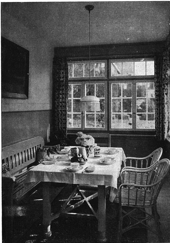
Blick in die Veranda