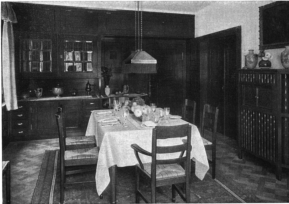
Blick in das Esszimmer