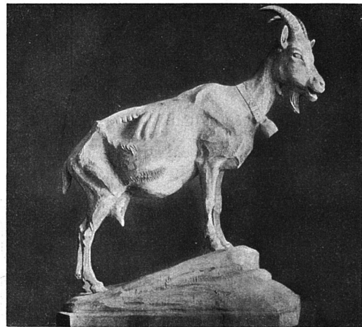
Die Schnitzerschule Brienz, an der Ausstellung für Kunstindustrie im kantonalen Gewerbemuseum in Bern