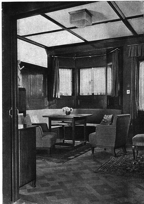
Ecke im Wohnzimmer