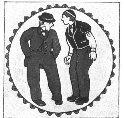
Kachelnfrües am Ofen im Restaurant Hader in Bern. — Entwurf Kunstmalers E. Linck in Bern. — Ausführung Wannenmacher & Chipot in Biel