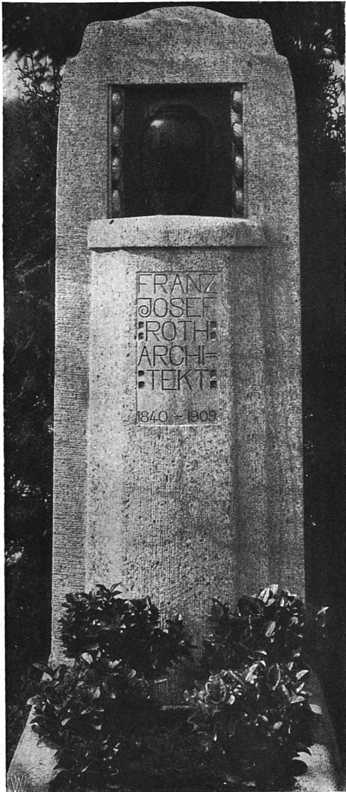
Entwurf Architekt W. Roth in Zürich