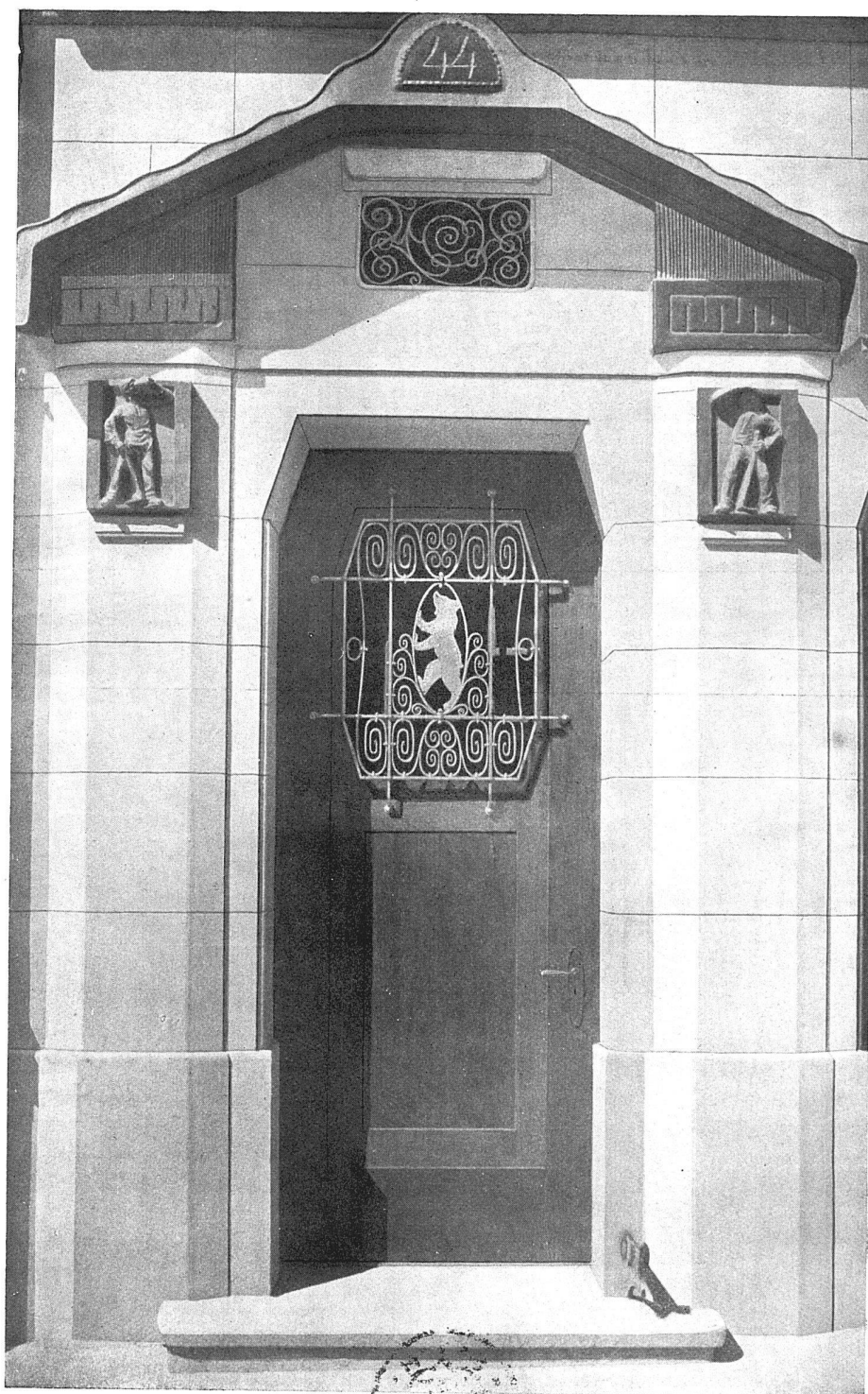
Eingang an der Neugasse

Bronzereliefs von Bildhauer Hermann Hubacher in Bern. Schmiedeeiserne Türfüllung von C. Niederhäuser & Cie. in Bern