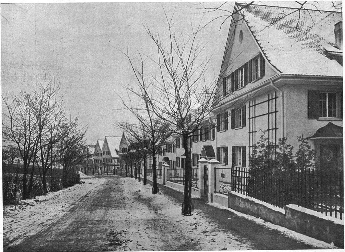
Ansicht der Fünfhäusergruppen an der Brühlbergstraße

Zur Ueberbauung des Brühlbergareals in Winterthur. Architekten B. S. A. Fritschi & Sangerl in Winterthur