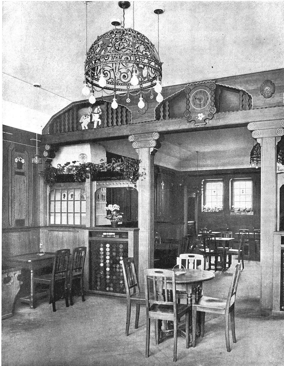
Gaststube im Erdgeschoß