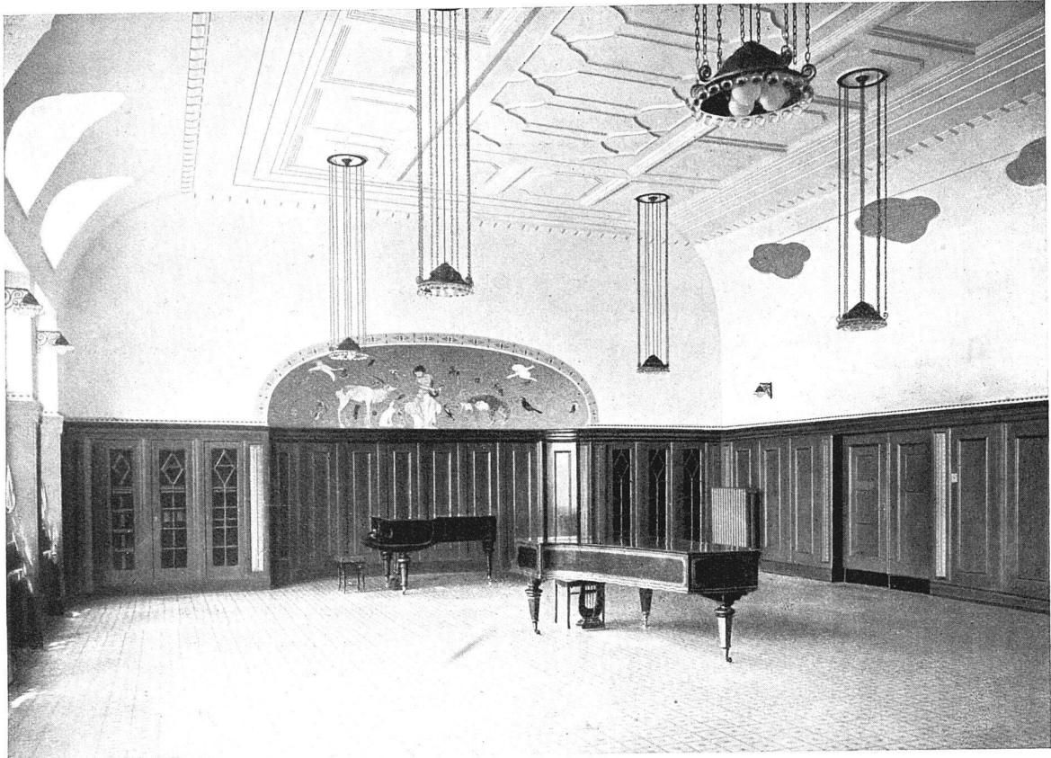
Die Kantonschule in Frauenfeld. Architekten B. S. A. Brenner & Stutz in Frauenfeld: Der Musik-Saal