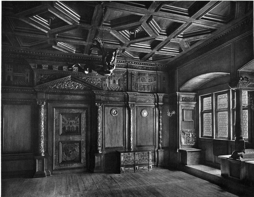
Wohn- und Festräume aus sechs Jahrhunderten. Schloß Haldenstein bei Chur (Kt. Graubünden). Zimmer von 1548