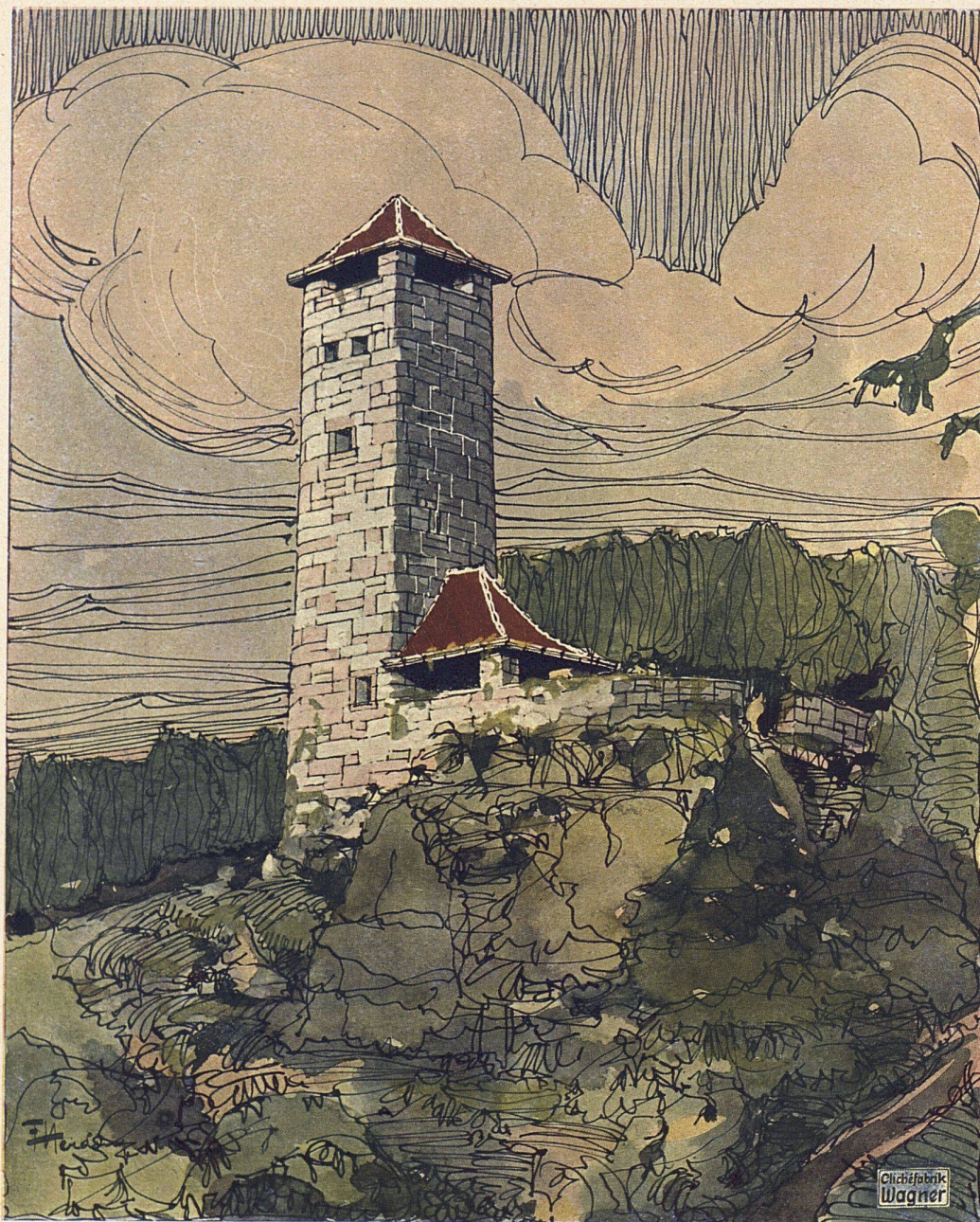
Nach dem Aquarell des Architekten Gedruckt bei N. Suter & Cie., Bern