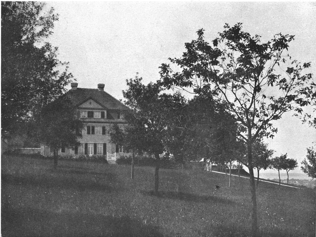
Ansicht vom Garten

Landhaus bei Lägerwilien :: am Unter-See (Kt. Thurgau)