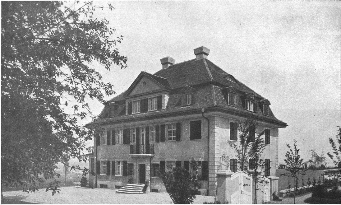
Ansicht mit Haupteingang