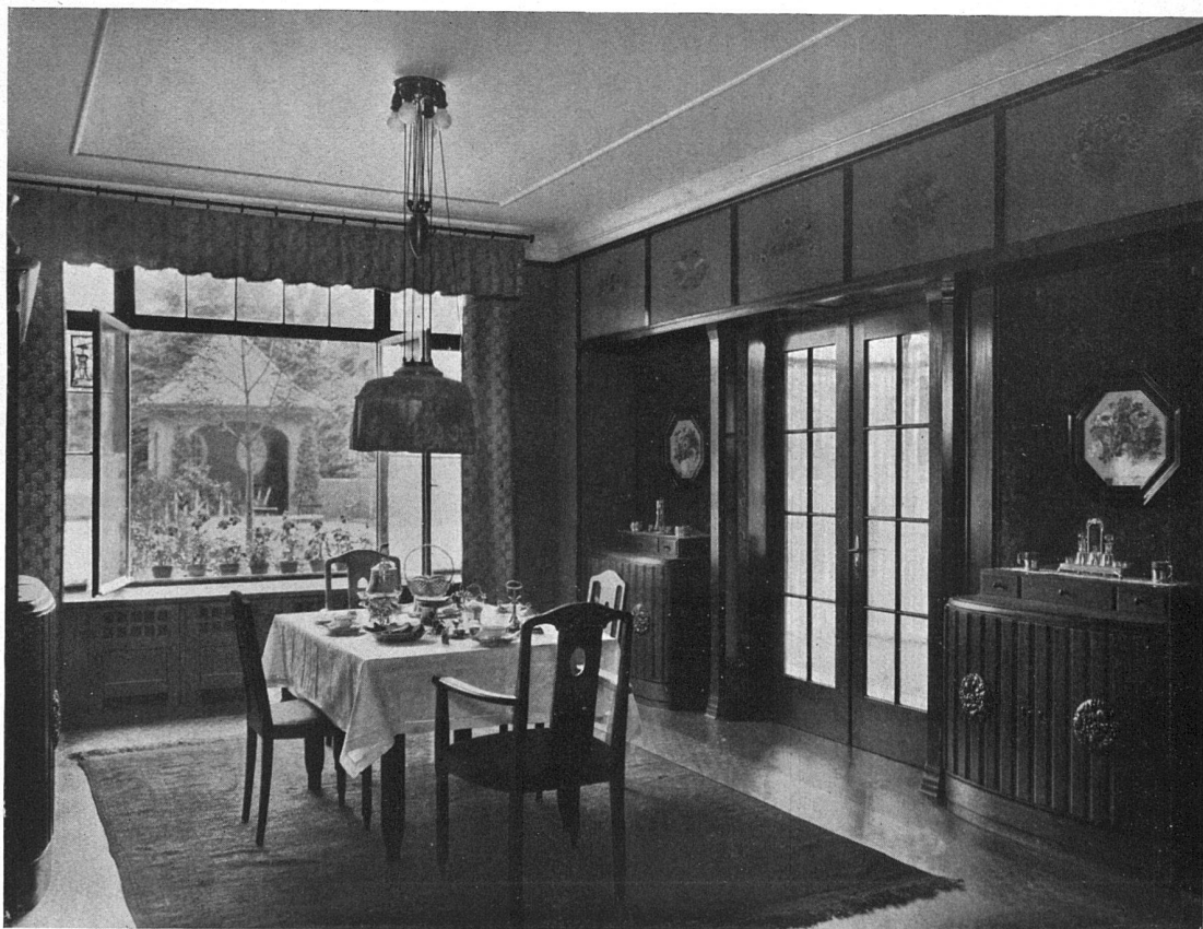
Esszimmer im Parterre mit Blick in den Garten

Eines aber haben die meisten gemeinsam: Einen chronischen Mangel an Arbeit, an Aufträgen! Wenn auch nur jeder einzelne ein einzig Häuschen unter Dach brächte im Jahr, bedeutete dies einen Zuwachs von mehreren Tausend Häusern! Und sitemalen unsere Kollegen welscher Zunge das kleine Einfamilienhaus als