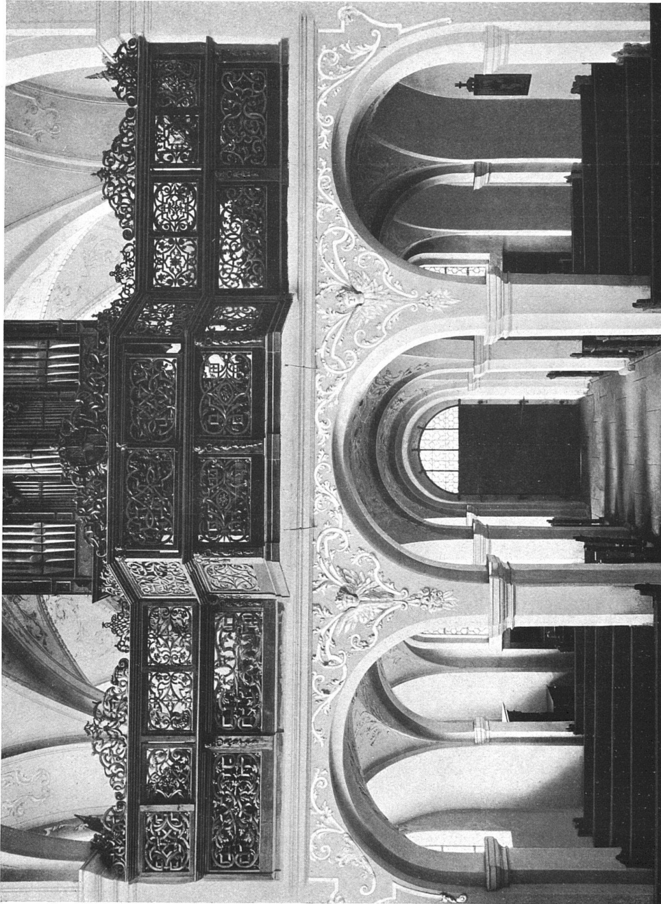
Der Nonnenchor in der Kirche des ehemaligen Benediktiner-Frauenklosters zu Münsterlingen (Kt. Thurgau).

Der Regierungsrat verlangt vom Grossen Rate für den Bau einer Turnhalle der Kantonsschule einen Kredit von 83500 Fr. Die neue Turnhalle kommt direkt neben das Kantonsschulgebäude zu stehen. -m.