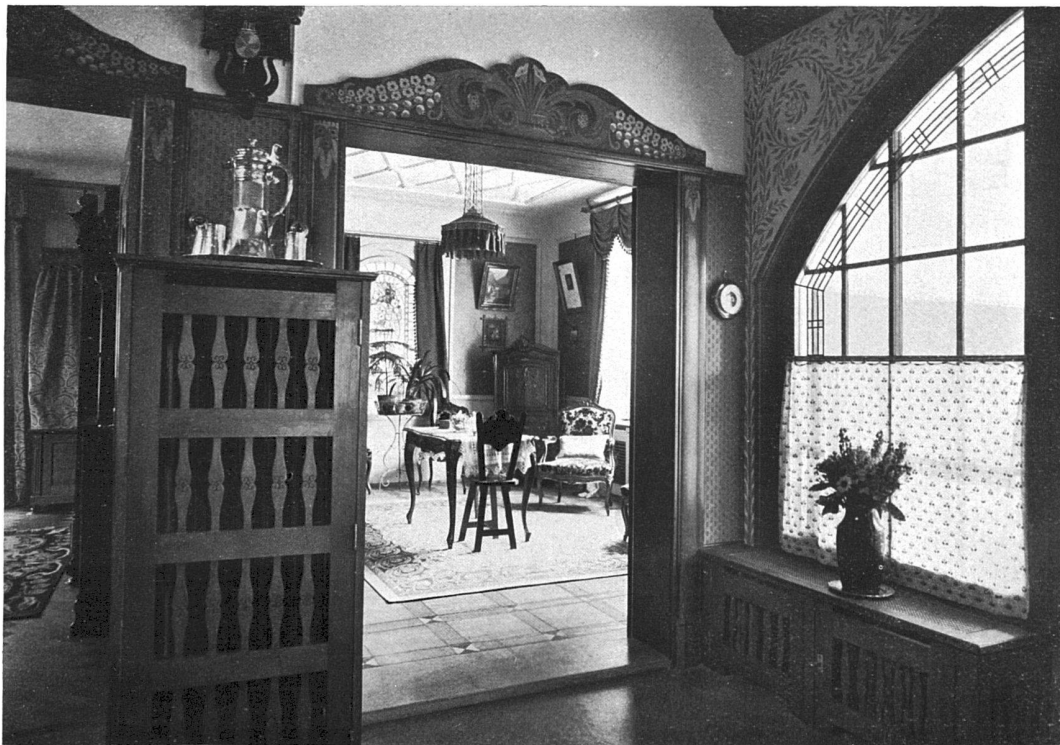
Die Halle der Villa Trauffer-Gempeler zu Interlaken. Architekten Urfer & Stähli, Interlaken.