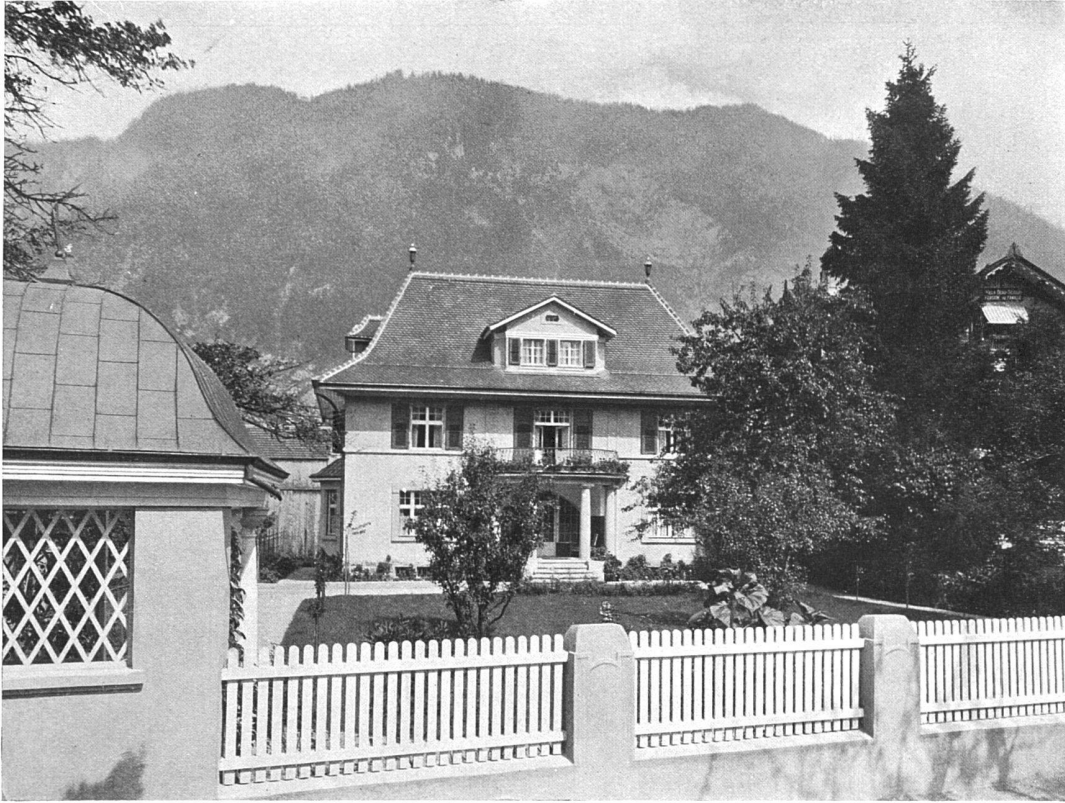
Ansicht der Villa Trauffer-Gempeler zu Interlaken von der Gartenstrasse. Architekten Urfer & Stähli, Interlaken.