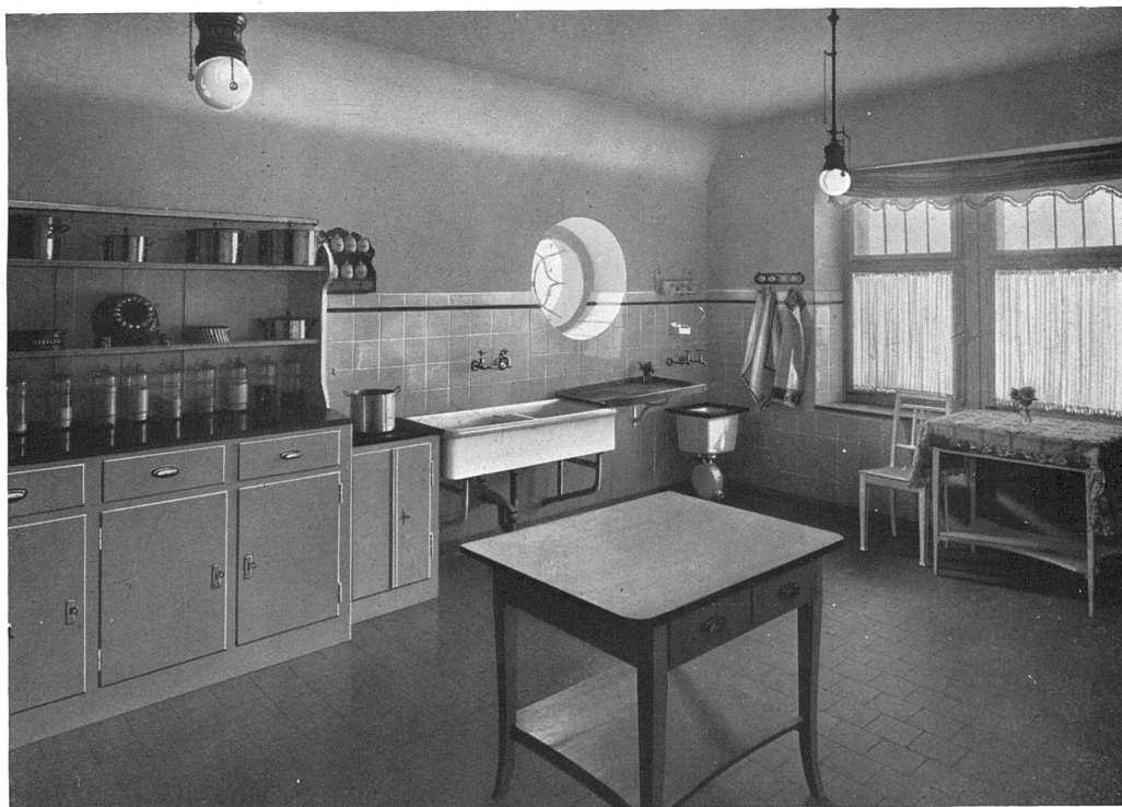
Aus der Küche einer Villa im Rigiquartier zu Zürich. — Architekten Marfort & Merkel, Zürich. Herd für Kohle und Gasbenützung; kombinierbare Warmwasserbereitungsanlage; Feuerton-Spültisch; porzellan-emailierter Astoria-Ausguss mit Holzrand. Alle Apparate von Bamberger, Leroi & Co., Zürich und Frankfurt a. M. — Installationen von Guggenbuehl & Müller, Zürich.