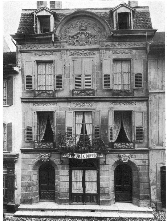
Altes Haus in Orbe (Kt. Waadt).