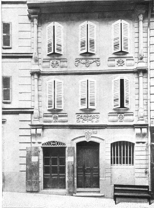
Altes Haus in Moudon (Kt. Waadt).