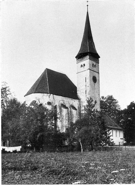
Alte Kirche in Interlaken (Kt. Bern).