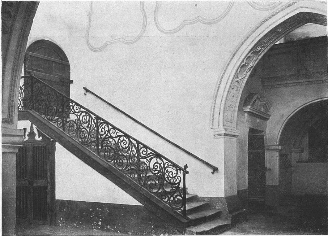
Aus der Klosterkirche zu Wettingen bei Baden (Kt. Aargau).