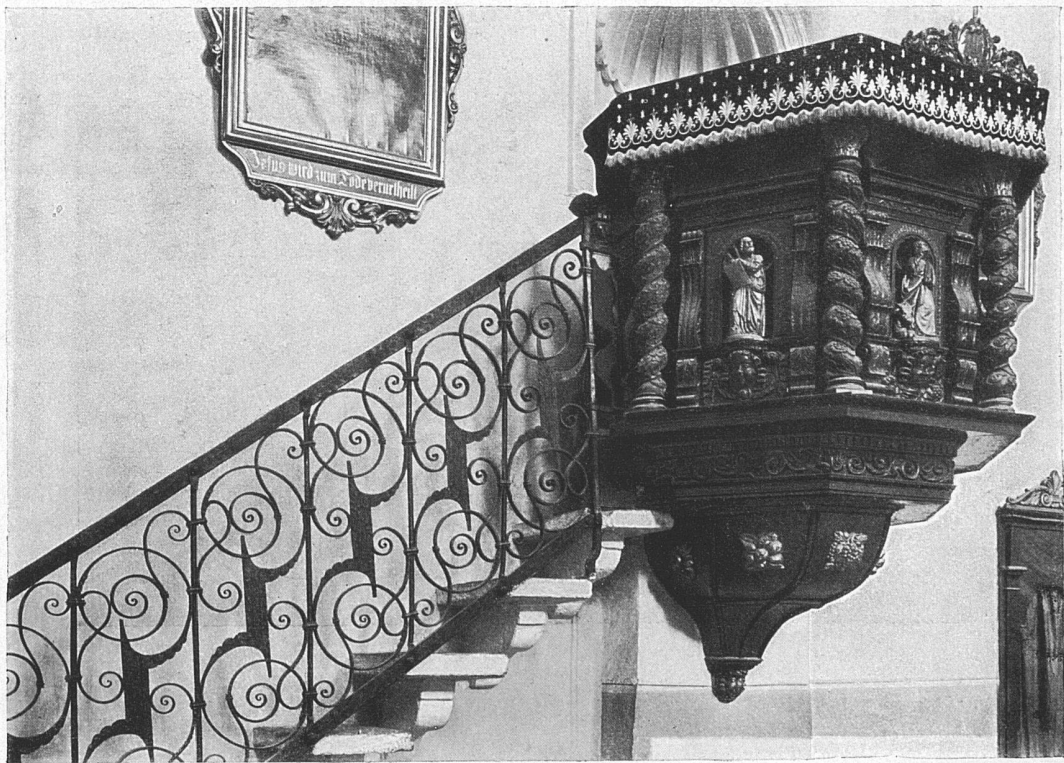
Die Kanzel in der Kirche zu Viège (Kt. Wallis).