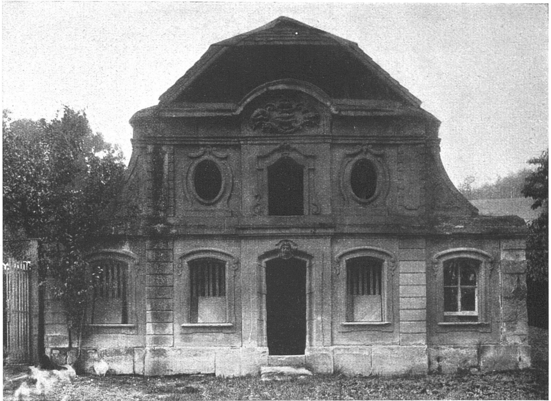
Pavillon im Türler'schen Gut zu Gümligen bei Bern

Auch im Baugewerbe konnte man so ziemlich allgemein die Erscheinung konstatieren, dass die Zeiten der Materialknappheit vorüber sind. Die einzelnen Firmen sind nicht mehr gezwungen, das ganze Rohmaterial für die gangbaren Konstruktionen