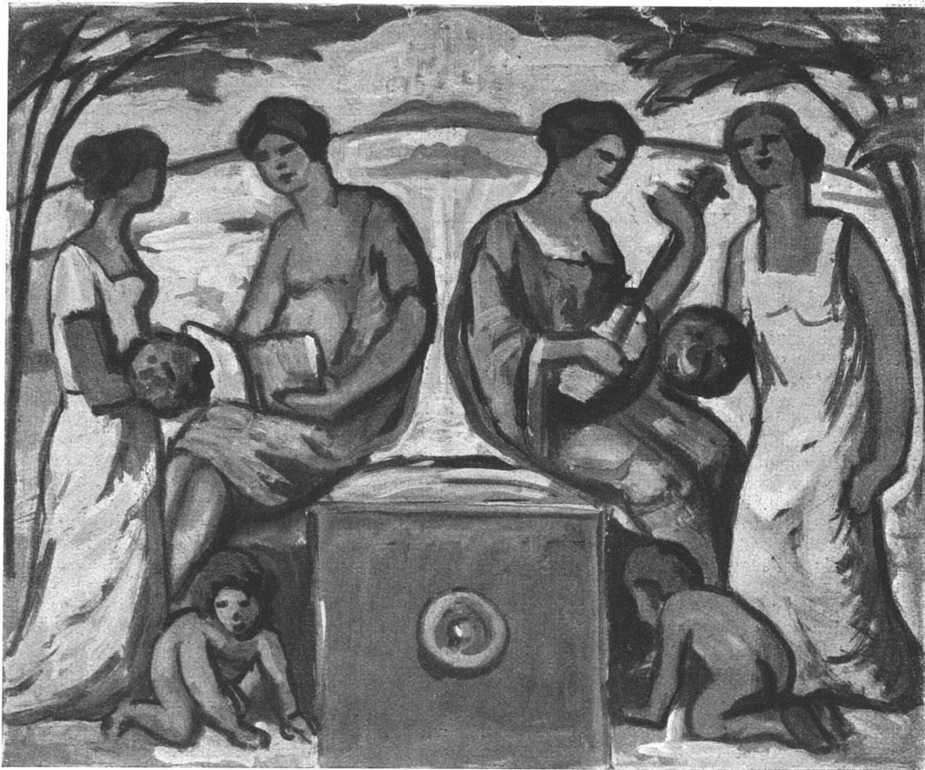
Preisgekrönter Entwurf von P. Altherr, Basel für die Bemalung des Rosentalbrunnens (Siehe unsern Artikel „Wettbewerb in Basel“)

soll — gegen Honorierung — bei Trennung und Differenzierung je nach Neigung und Können bestehen in der 1. künstlerischen Fortbildung in Meisterateliers und Werkstättenarbeit in Sinne Th. Fischers und Pölzigs, 2. Praxis bei Privatarchitekten und Unternehmern, 3. Ausbildung zum Ver-