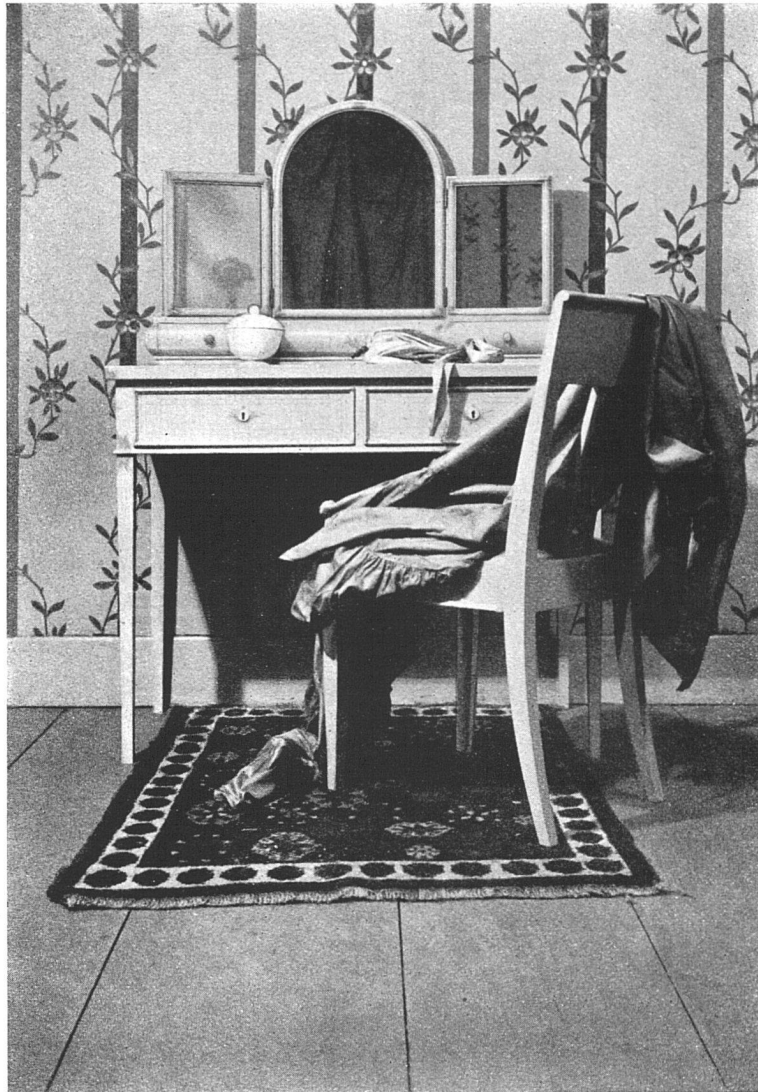
Toilettentisch, entworfen von P. Hosch, Basel Ausführung: Möbelfabrik Zipfel-Honold, Basel