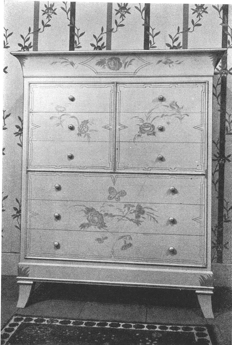
Wäscheschrank für Schlafzimmer, entworfen von Architekt P. Hosch, Basel Ausführung: Möbelfabrik Zipfel-Honold, Basel