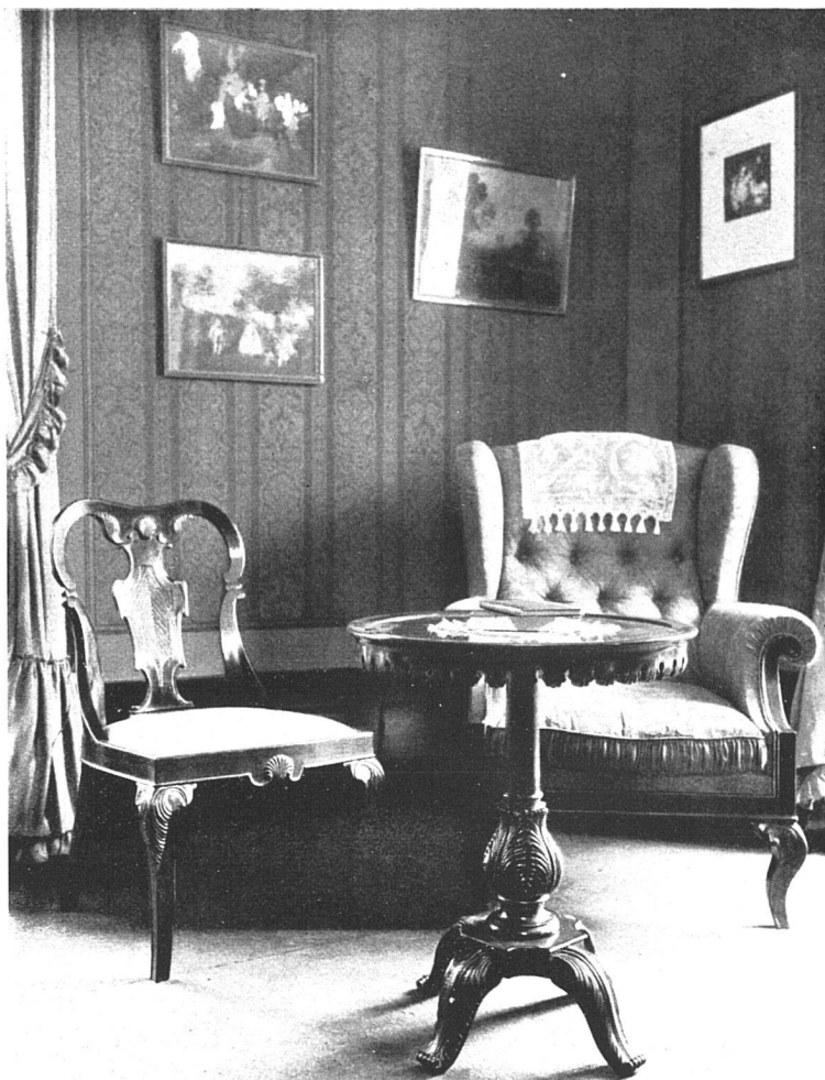
Aus einem Salon in Thun — Von Architekt M. Lutz, Thun