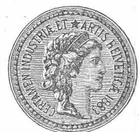
(M 1293 Z)