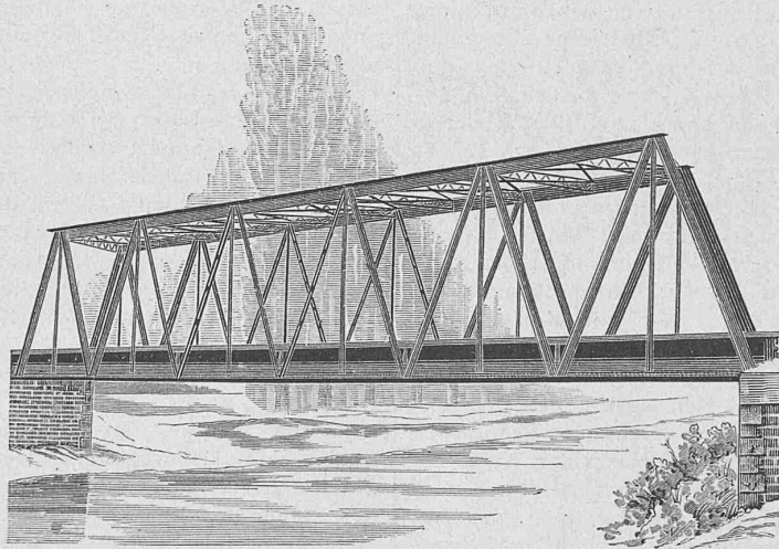
Perspectivische Ansicht nach einer Photographie.