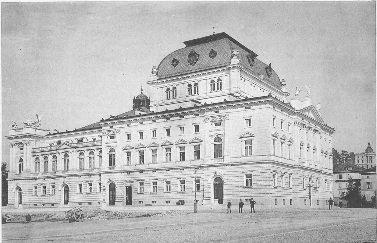
West- und Süd-Façade.