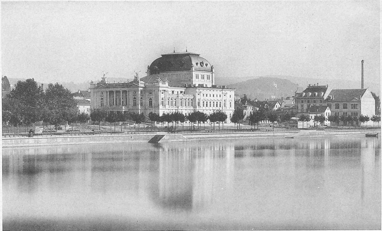
Ansicht vom See aus.