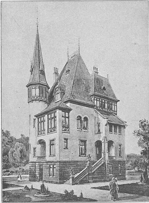
Perspective nach einer Photographie.

Architekten: Erdmann & Spindler in Berlin.