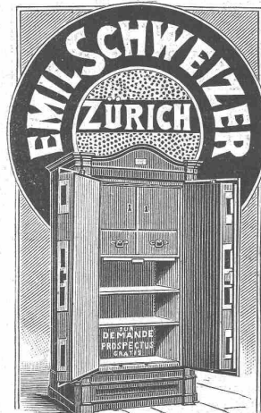
vormal Cosulich-Sitterding gegründet 1840.