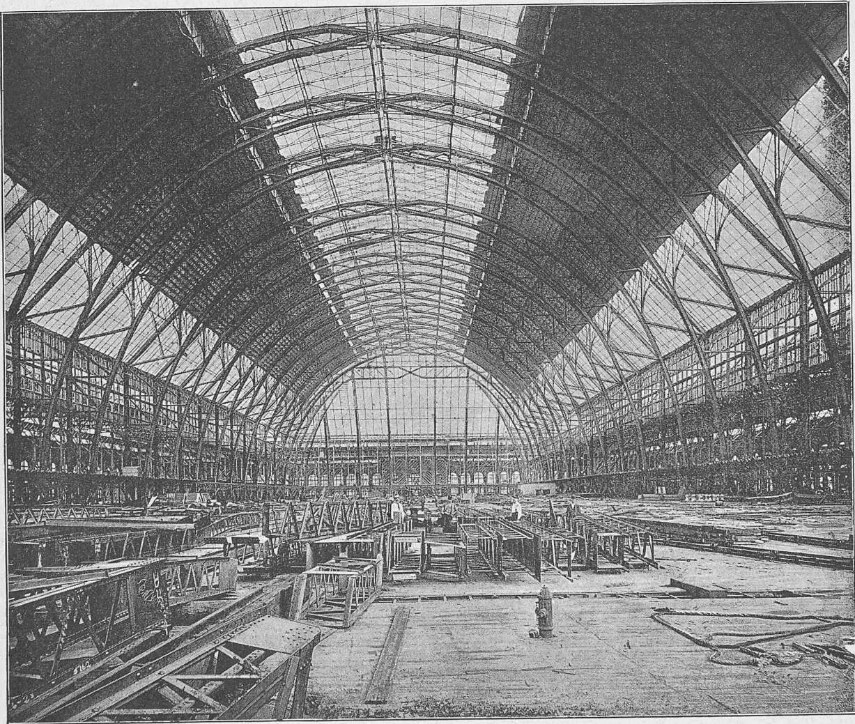
Innenansicht des Mittelbaues.

Gebäude für Industrie und freie Künste. — Konstrukteur der Mittelhalle: Oberingenieur Shankland.