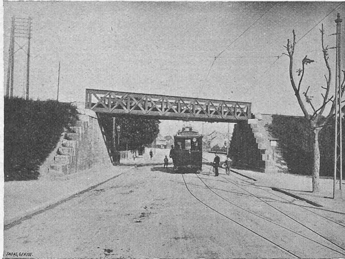
Durchfahrt unter der Verbindungsbahn.