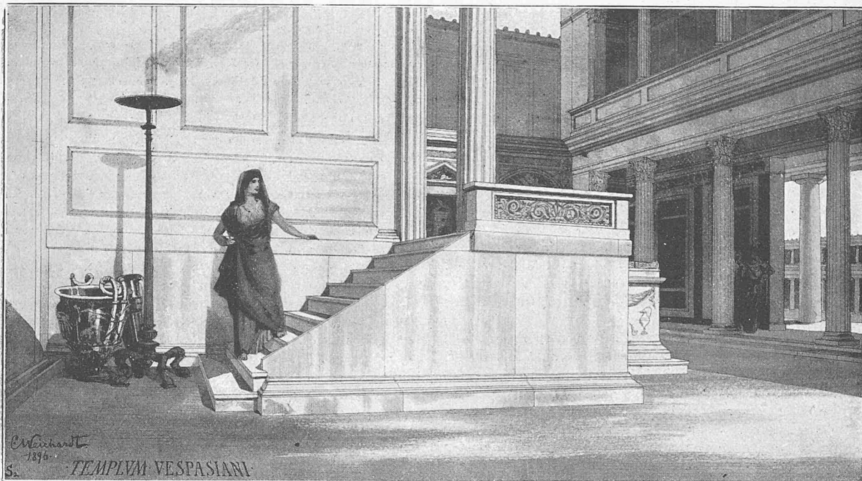
Fig. 8. Seitenansicht. Rekonstruktion zu Fig. 7.