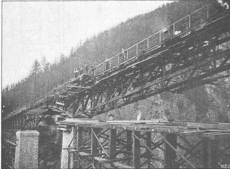
Fig. 13. Findelenbach-Brücke im Bau.

Das adoptierte Trägersystem in der gesamten Ansicht zeigt Fig. 14. Die Seitenöffnungen von 28 m sind durch Fachwerkträger überspannt, welche von den Pfeilern aus gegen die Mitte der gleich grossen Mittelöffnung in einem freitragenden Teil mit parabolisch gekrümmtem Untergurt endigen. Auf den Enden der 11,2 m freitragenden Teile ist das vollständig ausgeführte Mittelstück derart aufgelagert, dass der stetige Uebergang von einem Kragträger zum andern hergestellt wird. Die Auflagerung bei a ist aus der bezüglichen Detail-Figur (Ansicht des Gelenkes bei a) ersichtlich; diejenige bei b ist ähnlich wie bei a, nur mit dem Unterschied, dass das Bolzenloch länglich ausgeführt ist, um dadurch den Temperaturschwankungen Rechnung zu tragen, weil die festen Kipplager der Hauptträger auf