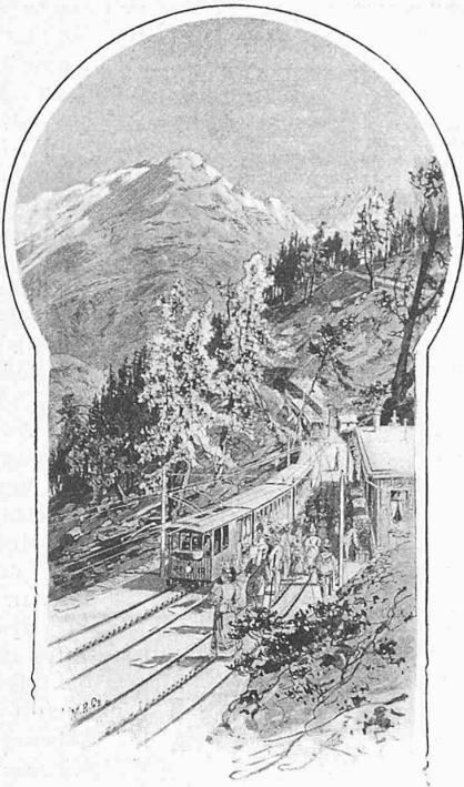
Fig. 29. Station Riffelalp.

ausstellung. Elektrische Strassenbahn in Peking. Innere Ausschmückung eidg. Bauten. Der Oesterreichische Ingenieur- und Architekten-Verein in Wien. Die VI. Jahresversammlung des Verbandes Deutscher Elektrotechniker. — Konkurrenzen: Neubauten für die Universität von Kalifornien in Berkeley bei San Francisco. — Preisauschreiben: Die Erfindung einer Vorrichtung zur Verhinderung einer willkürlichen Ueberlastung der Sicherheitsventile bei Schiffsdampfmaschinen. — Litteratur: Ergebnisse der Untersuchung der Hochwasser-Verhältnisse im deutschen Rheingebiet. Die Technikerfrage eine Titelfrage. — Vereinsnachrichten: Gesellschaft ehemaliger Studirender: Stellenvermittlung. — XXIX Adressverzeichnis.