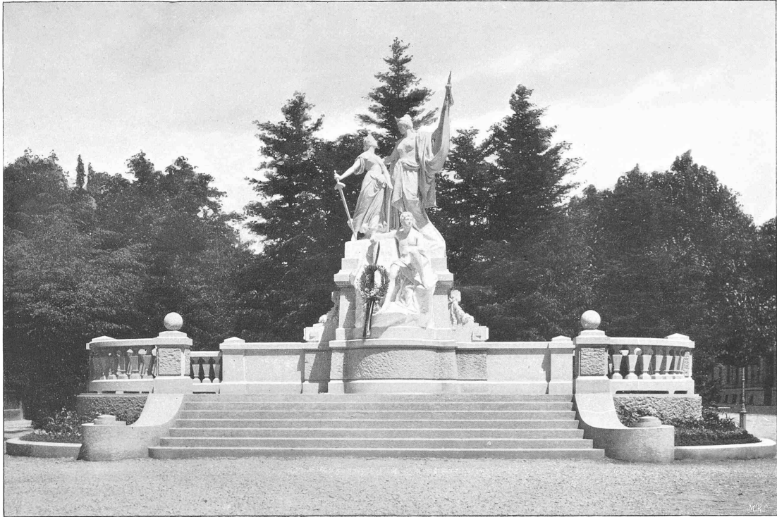
Denkmal zur Erinnerung an die Begründung der Republik Neuenburg.

Bildhauer: A. Heer und A. Meyer in Basel.