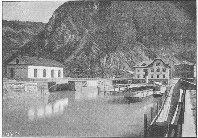
Fig. 7. Landungsplätze im Hafen zu Interlaken.

Verhältnis des eingetauchten Schiffsquerschnittes zum benetzten Kanalquerschnitt und von der Fahrtgeschwindigkeit ab. Je grösser das Kanalprofil, desto geringer der Widerstand,