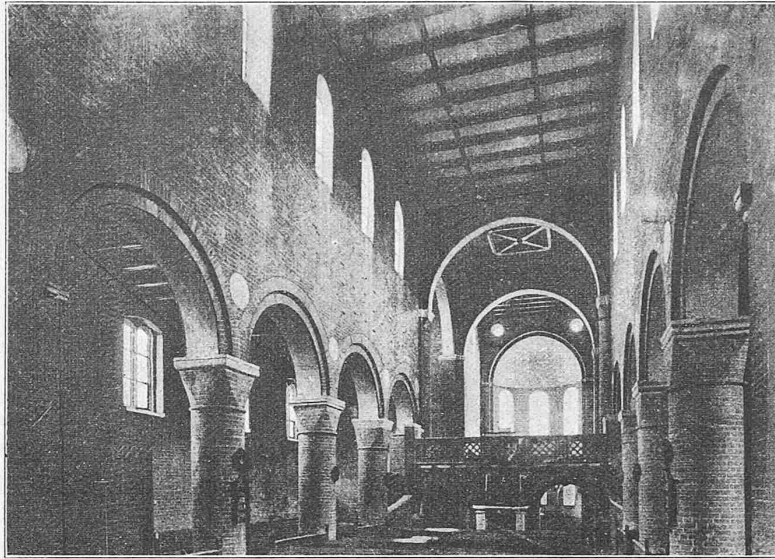
Fig. 18. Klosterkirche zu Jerichow.