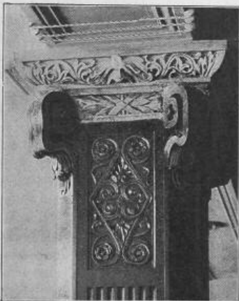
B. A. W. Fig. 64. Pfeilerkapitäl.

In den weitem Abschnitten dieses Kapitels schildert der Verfasser die Befestigungsanlagen in den alten Städten, vornehmlich in den griechischen und römischen, dann werden die gesetzlichen Bestimmungen über die Ordnung in den städtischen Strassen, die Bauart der Häuser u. s. w. angeführt, um hernach auf die Strassenkonstruktion selbst einzutreten. In griechischen Städten war die Pflasterung der Strassen gar nicht allgemein eingeführt, in Athen viele Strassen nur mit Gerölle befestigt. Gut gepflastert war Alexandria; auch in Rom, wie in andern italienischen Städten, waren die meisten Strassen gepflastert und vorschriftsgemäss mit Trottoirs versehen. Im Centrum jeder Stadt gab es einen grösseren Platz, der als Marktplatz und für Volksversammlungen, Festlichkeiten u. s. w. bestimmt war. Strassenbeleuchtung existierte so zu sagen gar nicht, und der Verkehr mit Wagen in den städtischen Strassen