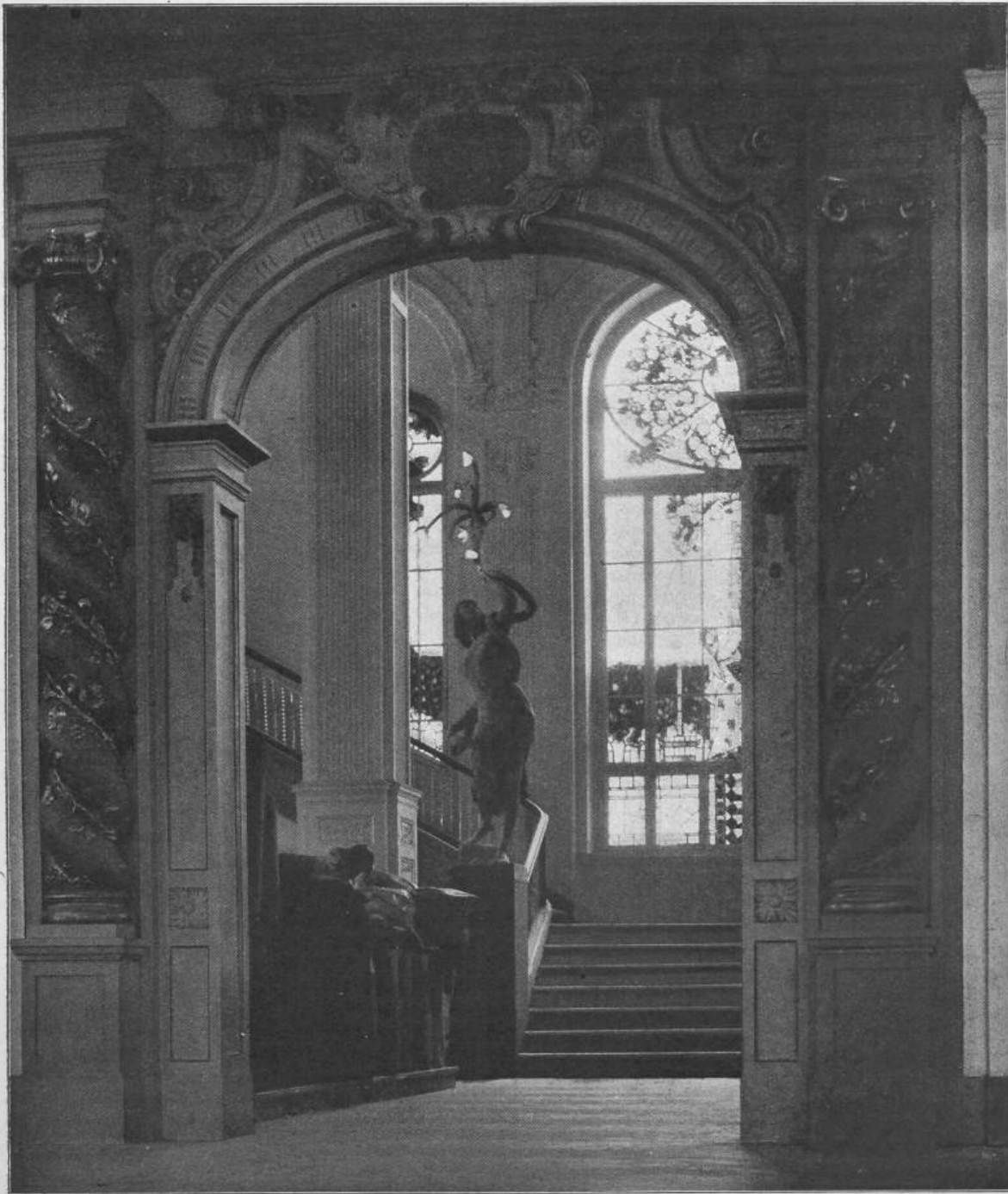
D. B. Fig. 66. Kaufhaus Wertheim, Leipziger-Strasse 132—133. — Eingang zum Teppichraum.

Architekten: Messel & Allgelt in Berlin.