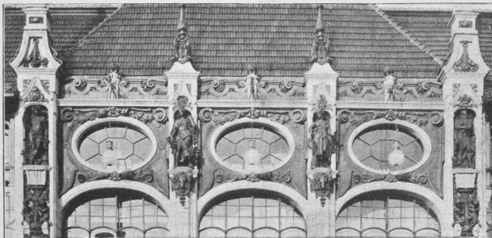
B. A. W. Fig. 62. Kaufhaus Wertheim, Leipzigerstrasse 132—133. — Krönung des Mittelbaus. Architekten: Messel & Altgelt in Berlin.