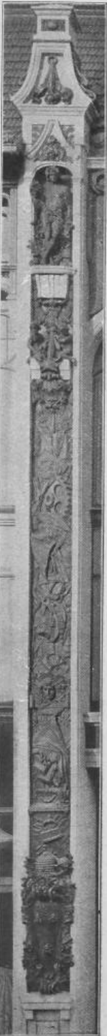
D. B. Fig. 67. Pfeilerrelief am Mittelbau der Hauptfront.