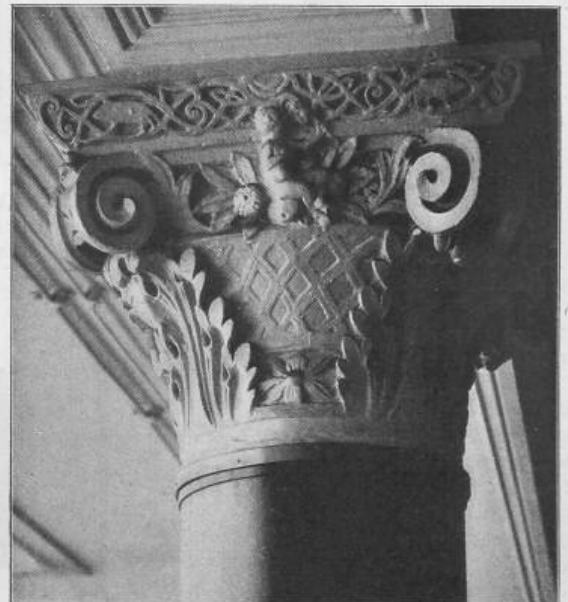
D. B. Fig. 65. Säulenkapitäl.

Die Schaufenster liegen zwischen den Pfeilern tief zurückgesetzt, aber im untern Teile, in Höhe des Erd- und etwa der Hälfte des ersten Obergeschosses sind dieselben erkerartig vorgezogen, in der Art wie vor Zeiten die Schaufenster der rheinischen Kaufhäuser gebildet waren, doch hier freilich ohne Sprossenwerk, das Gerippe aus blankem Messing. Die Schutzläden werden bei Nichtgebrauch in das Kellergeschoss versenkt, wobei der verbleibende Führungsschlitz mit selbstthätigen Klappen sich verdeckt. Der