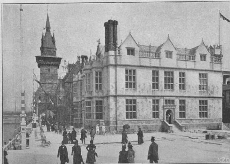
Fig. 12. Der englische Pavillon.

Architekten: Zoltan Balint und L. Jambor .