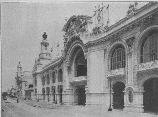
Fig. 33. Palast für verschiedene Industrien.

Diese Anlage bildet eine Art Forum von theatralischer Pracht. Die Fortsetzung der Strasse von dem Forum bis zum Schluss an der Avenue de la Motte Piquet zeigt