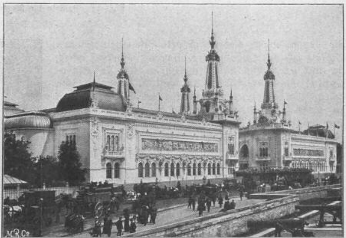
Fig. 34. Palast für Dekoration und Mobiliar. — Hinterfassade.