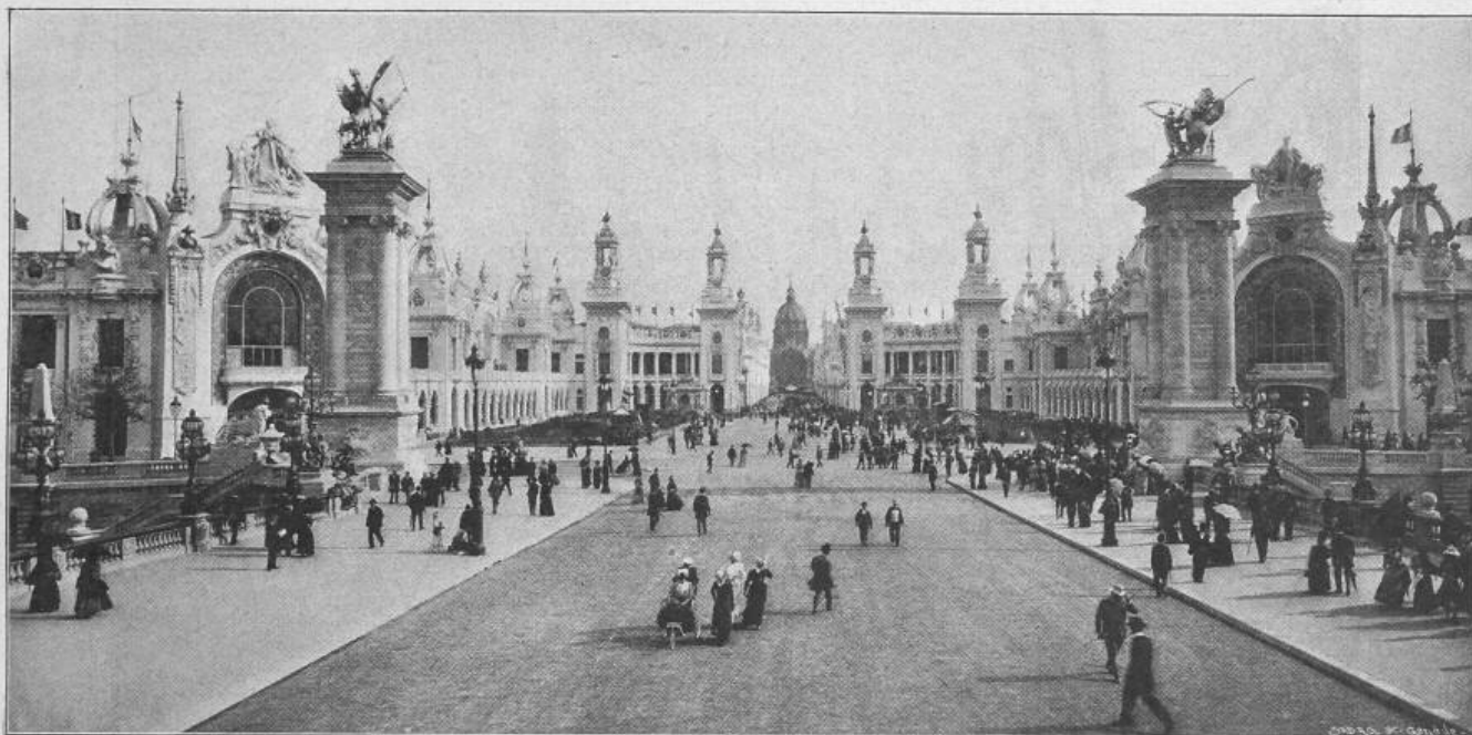
Fig. 31. Invaliden-Esplanade, von der Alexander-Brücke aus gesehen.

in Paris. Polytechnikum in Pittsburg (V. St.) — Konkurrenzen: Neubau eines Knabensekundarschulhauses in Bern. Central-Museum in Genf. — Preisausschreiben: Preisausschreiben des Vereins für Eisenbahnkunde zu Berlin. — Nekrologie: † H. V. von Segesser. — Vereinsnachrichten: Zürcher Ingenieur- und Architekten-Verein. Gesellschaft ehemaliger Studierender: Stellenvermittlung.