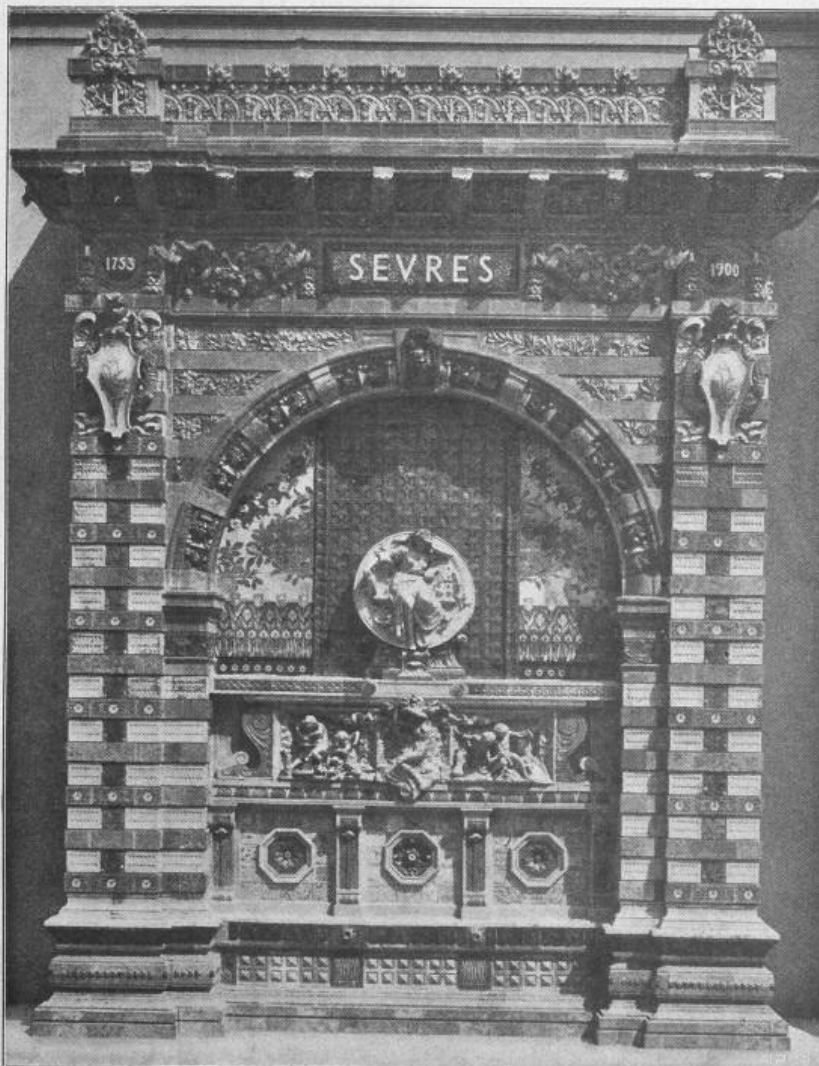
Fig. 35. Fayence-Portal in der Sèvres-Ausstellung.

Architekt: Ch. Risler, Bildbauer: J. Coutan.