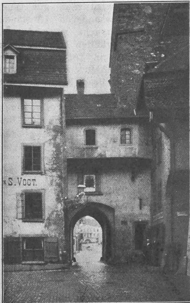
Das alte Oberthor in Aarau. — Nordansicht.

Wenn es an den Umbau oder die Beseitigung alter, aus früheren Jahrhunderten stammender Bauwerke geht, so tritt immer die Frage in den Vordergrund: Begehen wir nicht einen Vandalismus, wenn wir solche ehrwürdige Ueberbleibsel aus dem Mittelalter den Verkehrsbedürfnissen der Gegenwart zum Opfer bringen? Diese Frage hat man sich in Aarau auch gestellt und wir dürfen sagen, dass die Behörden der Stadt mit aller Schonung und in pietätvoller Weise vorgegangen sind. Nach dem Entwürfe des Stadtbaumeisters von Aarau, Herrn Architekt A. Hassler , soll nur das Innere Thor, das zwischen den Häusern eingebaut ist und keinen archäologischen Wert hat, niedergelegt werden. Das „Oberthor“, ein stolzer Turm, dessen Mauerwerk aus der Römerzeit stammen soll, wird nur umgebaut und zwar in sorgfältigster Erhaltung der früheren äusseren Erscheinung. Dem Umbau kommt zu gut, dass der Turm nicht selbst das Thor enthält, sondern dass jenes an den Turm angebaut ist. Auf diese Weise ist es möglich, den charaktervollen Turm zu erhalten und nur das daneben liegende Thor umzubauen. Ueber den Umbau geben die beifolgenden Abbildungen so genügende Auskunft, dass wir diesen nur wenig beizufügen haben. Das bestehende Thor hat, wie bereits bemerkt, zwischen den Abwehrsteinen eine Lichtweite von 2,30 m, während die lichte