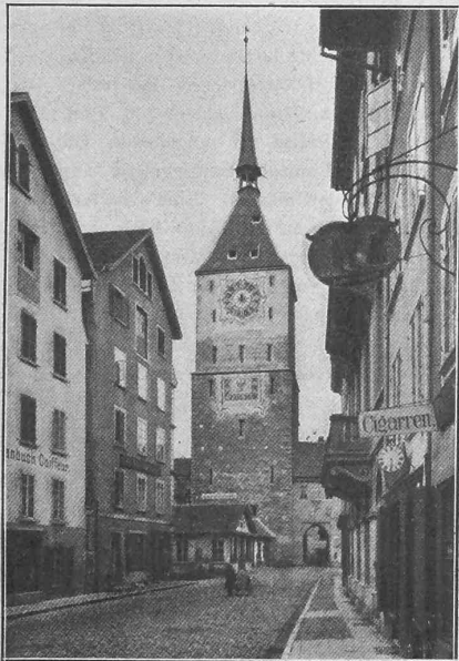
Das alte Oberthor in Aarau. — Südansicht.

«Wenn man, wie der Bericht des Verwaltungsrates der Nordostbahn für 1894 es bei Erläuterung des Zürcher Bahnhofentwurfes mit Recht thut, eine Zukunft von 30 und mehr Jahren ins Auge fasst, so darf den augenblicklichen Schwankungen in der örtlichen und selbst in der allgemeinen Verkehrszunahme für die Bemessung der endgültigen Bahnhofanlage keine grosse Bedeutung beigemessen werden; es scheint uns vielmehr auch hiernach der Umfang des Entwurfes in seiner Gesamtheit nicht zu gross gegriffen. Auch in Bezug auf seine Ausstattung und die allgemeinen Anordnungen, wie Trennung der verschiedenen Verkehre, Vermeidung schädlicher Geleisekreuzungen und dergleichen, geht der Entwurf nicht über die an einen modernen Bahnhof zu stellenden Anforderungen hinaus. Hinsichtlich der Ausbildung des Rangierbahnhofes aber müssen sogar die im Projekt vom 4. Februar 1895 für Auscheidung der angekommenen Güterwagen nach Bahnrichtungen und Unterwegs-Stationen vorgesehenen Geleise nach Zahl und Nutzlänge auf die Dauer für unzureichend erklärt werden.»