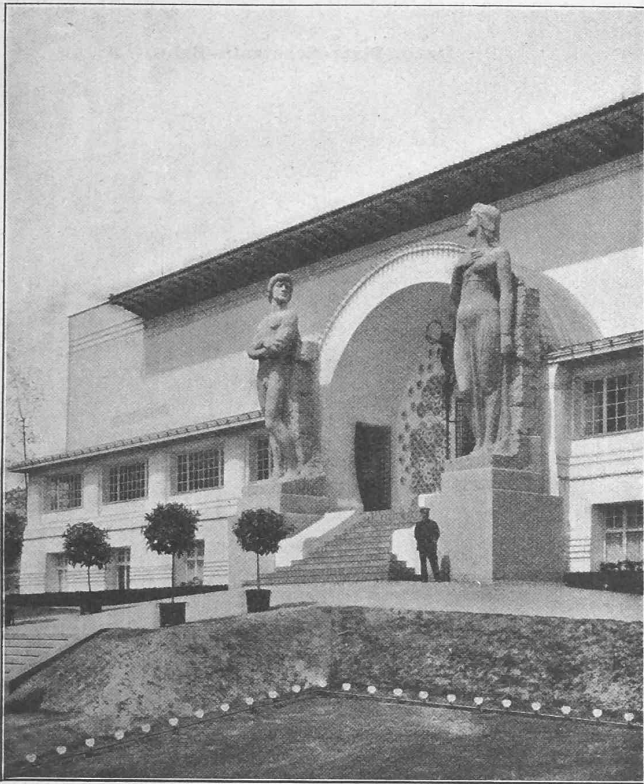
Abb. 4. Das Ernst Ludwig-Haus. — Architekt: Prof. Olbrich.

zwar durch eine einfache Halle erreichen, allein die sichtbaren Konstruktionsteile des Dachstuhles, die Stützen u. s. w. könnten auch noch die Phantasie des Zuschauers beschäftigen. Um diesem Uebelstande gründlich abzuhelfen, entschloss sich der Erbauer zu folgendem Radikalmittel: Er gab dem Zuschauerraum die Form einer grossen Tonne, ohne irgend welche architektonische oder konstruktive Gliederung; am Ende der Tonne befindet sich die erhöhte