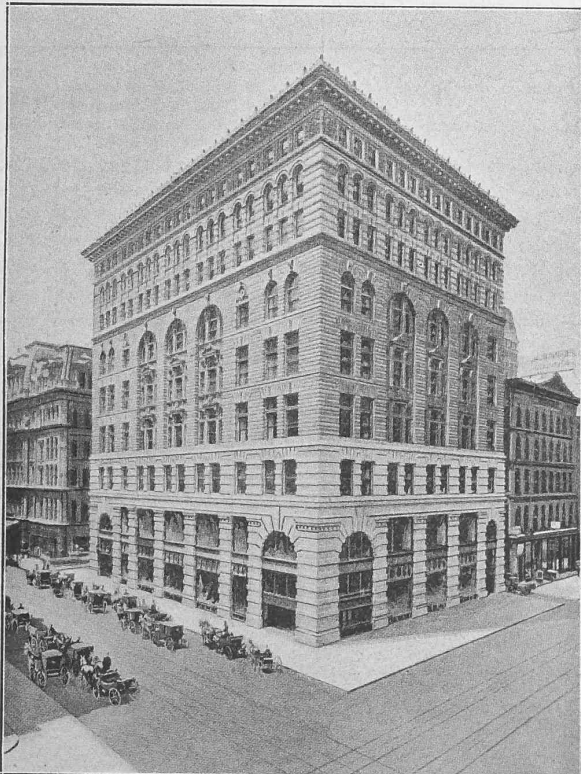
Abb. 48. Chicago. — Marshal Fields Building.