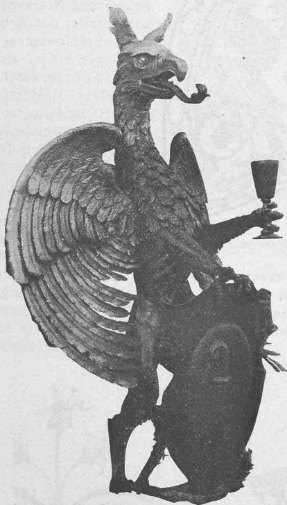
Abb. 1. Greif mit Basler Schild von R. Preiswerk & Esser in Basel.

Kaum mehr als ein Jahrzehnt trennt uns von der grossen internationalen Kunstgewerbeausstellung in München, die ungemein dazu beitrug, das Kunsthandwerk aus der Vernachlässigung herauszureissen. Der dort entfachte allgemeine Wettstreit nach Vervollkommnung der Technik, nach Erneuerung und Veredelung des Formensinnes und des