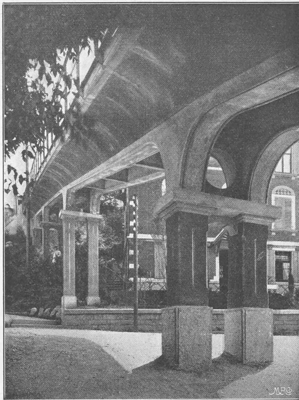
Abb. 8. Die Hadlaubbrücke. — Unterführung der Hadlaubstrasse.

geliefert. Die Wagen sind mit drei auf einer Seite angebrachten Zangenbremsen ausgerüstet, von denen die eine als Handbremse von den Plattformen aus in Thätigkeit gesetzt werden kann, während die andern bei einem Seilbruche automatisch wirken und auch von dem Kondukteur mittels eines Pedaltrittes geschlossen werden können. Von dem richtigen Funktionieren der automatischen Bremsen hat sich der Bahnmeister wöchentlich einmal zu überzeugen. Die zuerst bei der Stanserhorn-Bahn angewandte Zangenbremse ist von obgenannter Firma wesentlich verbessert und nach ihren bezüglichen besonderen Patenten ausgeführt worden.