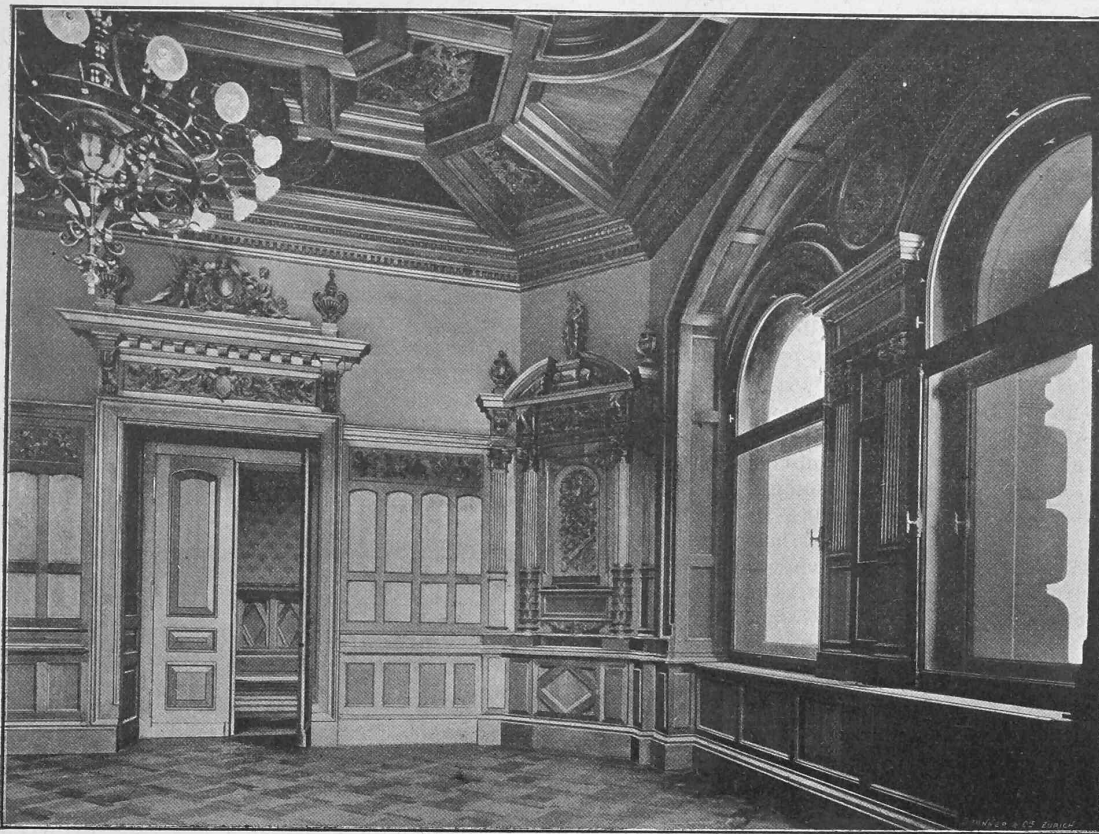
Neues schweizerisches Bundeshaus in Bern. — Kommissionszimmer Nr. VII (Brienzer Zimmer).

erträgnis in den letzten Jahren wesentlich gebessert hätte, kann von keiner dieser Unternehmungen behauptet werden; die Betriebsausgaben fallen schwer ins Gewicht und machen nirgends weniger als 63% der Einnahmen, in den meisten Fällen einen bedeutend höhern Prozentsatz derselben aus. Von den in obiger Tabelle nicht aufgeführten Tramways hatten einen guten oder befriedigenden Ertrag die Linien: Zürich-Hardturm, Zürich-Oerlikon-Seebach, Winterthur-Töss, Vevey-Chillon, einen schlechten Schwyz-Seewen, Stansstad-Stans, Aubonne-Gimel und Rolle-Gimel, Zürich-Höngg, Zentrale Zürichbergbahn.