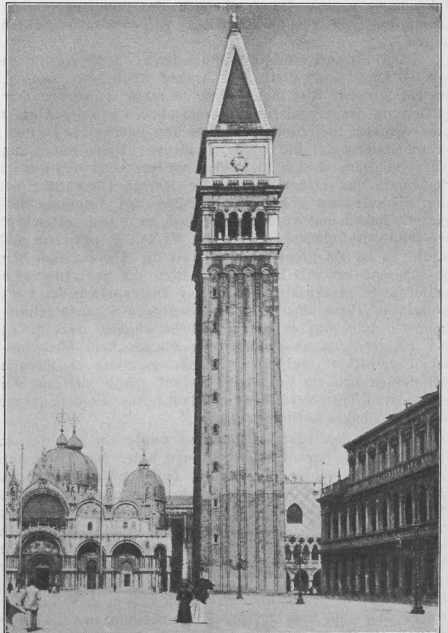
Ansicht des Turmes von der Piazza San Marco aus.

Sämtliche Entwürfe sind im Saale der Brauerei Oerlikon, von Sonntag 20. Juli bis Samstag 26. Juli, je vormittags von 8—12 und nachmittags von 1—7 Uhr öffentlich ausgestellt.