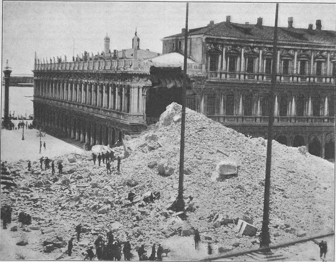
Nach einer Photographie.