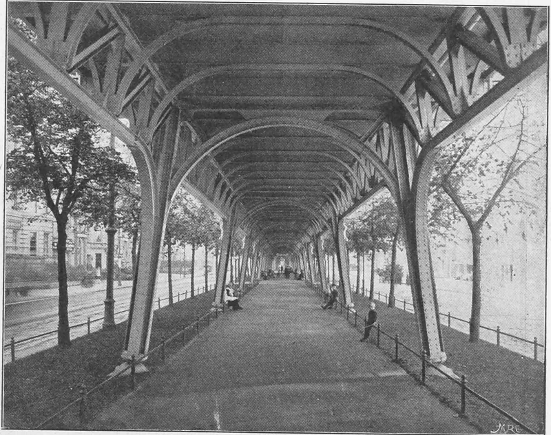
Abb. 11. Der Viadukt in der Bülowstrasse.

Besonderes Aufsehen erregt die elektrische Hauptschacht-Fördermaschine, die für die Gelsenkirchener Bergwerks-A.-G. von der Friedr. Wilhelms-Hütte in Mülheim a. Rh. und Siemens & Halske in Berlin gebaut worden ist. Zwei Gleichstrom-Elektromotoren von je max. 1400 P. S. Leistung treiben die Koescheibe von 6 m Durchmesser an. Die ökonomische Verwertung der elektrischen Energie wird durch eine Pufferbatterie erreicht, welche in vier Gruppen geteilt nach und nach so eingeschaltet wird, dass die Spannung Beträge von 125, 250, 375 und 500 Volt annimmt. Die Reihenfolge der Einschaltung wechselt gleichmässig ab, sodass die Anstrengung der einzelnen Elemente eine tunlichst gleichmässige ist. Die Erfahrung wird lehren ob die Stimmen recht behalten, die es als Wagnis bezeichnen, mit einem neuen System an so grosse Erstlingsausführungen zu schreiten; auf der Ausstellung erwies sich die Handhabung der Maschine als äusserst bequem und sicher.