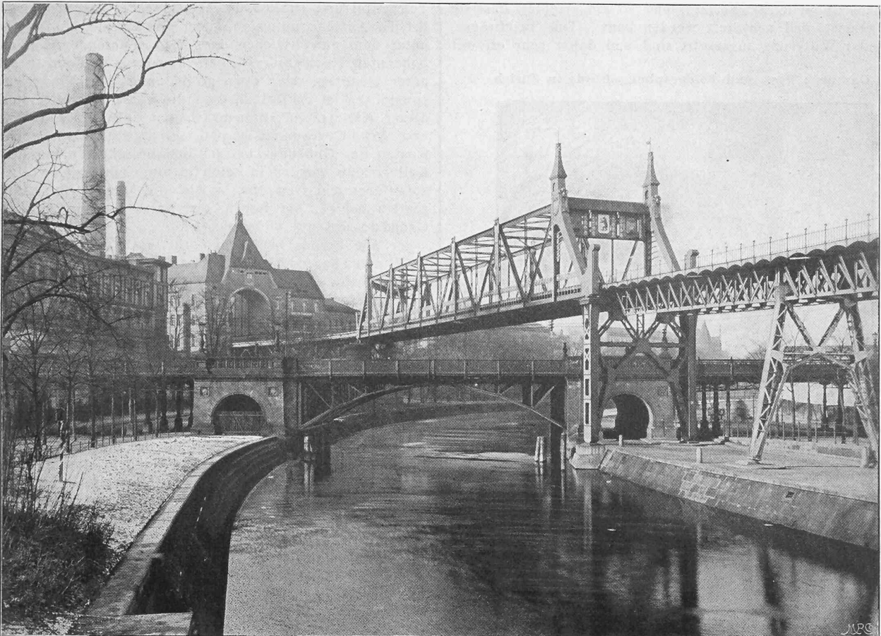
Abb. 15. Ueberbrückung des Landwehrkanals und der Anhalterbahn.

zu sein und der Zweitakt hat noch die schwierige Aufgabe zu lösen die etwas grosse Arbeit der Luft- und Gaspumpe einzuschränken.