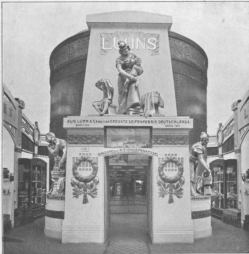
Abb. 12. Ausstellung von Aug. Luhrs in Barmen.