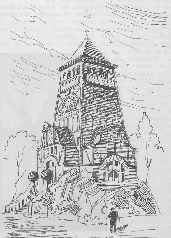
Abb. 25. Pavillon der Internationalen Bohrgesellschaft in Erkelenz im Rheinland.

Die Generalversammlung beschliesst ferner grundsätzlich die Gründung einer Eichstätte für elektrische Messgeräte , welche mit der Materialprüfungsanstalt zu verbinden ist. Eine detaillierte Vorlage über die