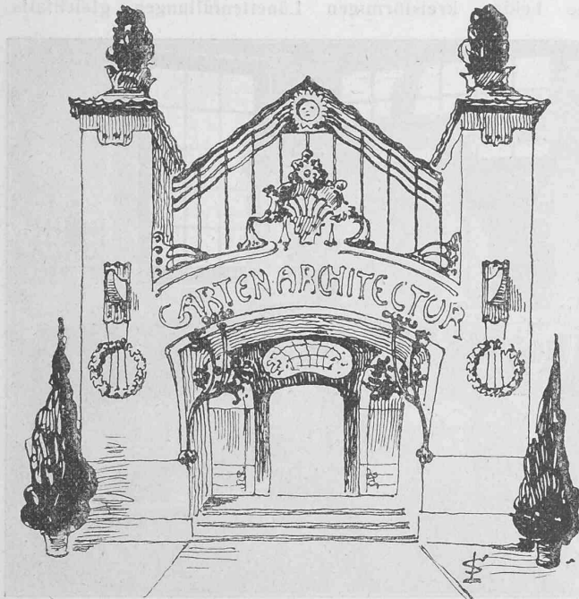
Abb. 20. Ausstellungsgebäude für die Gartenarchitektur von Rheinland und Westfalen.