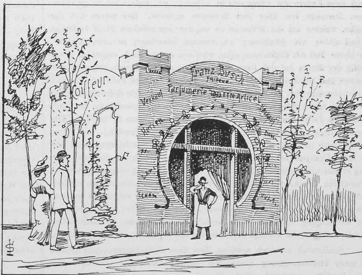
Abb. 31. Pavillon des Friseurs F. Busch.

Der bei den Strassenbahnen eingeführte elektrische Betrieb hat eine bedeutende Entwicklung genommen und erforderte erhöhte Geschwindigkeiten, sowie vergrösserte Wagengewichte. Es musste deshalb auch den Bremsvorrichtungen eine grössere Aufmerksamkeit zugewandt werden, um bei dem stets anwachsenden Strassenverkehre die immer häufigeren Unfälle möglichst zu vermeiden. Die bei Pferdebetrieb noch ausreichende, gewöhnliche Handbremse kann für die motorische Traktion nicht mehr genügen. Die nachher eingeführte Kuraschlussbremse ist nur bei den mit Motoren ausgerüsteten Wagen anwendbar und es tritt bei