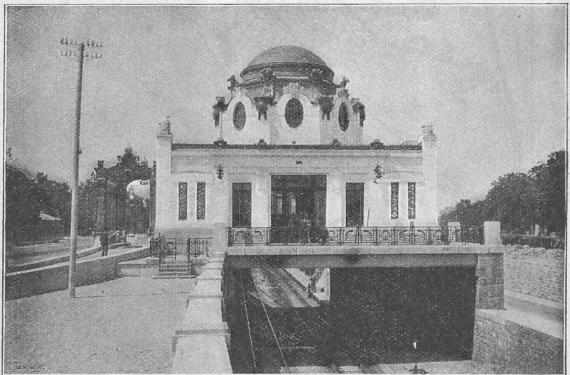
Abb. 3. Station Hietzing der oberen Wienthallinie.