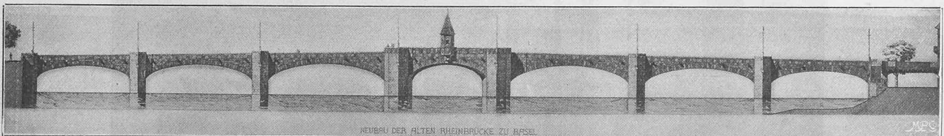
Eigene Aufnahme nach dem Original.

Die Stationen sind teils eigentliche Bahnhöfe für vollen Verkehr, teils Haltestellen, die nur dem Personenverkehr dienen. Von den erstern bilden die grössern Bahnhöfe, Hütteldorf, Heiligenstadt und Hauptzollamt, die Eckpunkte des Stadtbahnnetzes, wo die Stadtbahn-Züge formiert werden und andererseits an die Fernbahnen anschliessen. Kleinere Bahnhöfe befinden sich in Gersthof, Hernals und Ottakring