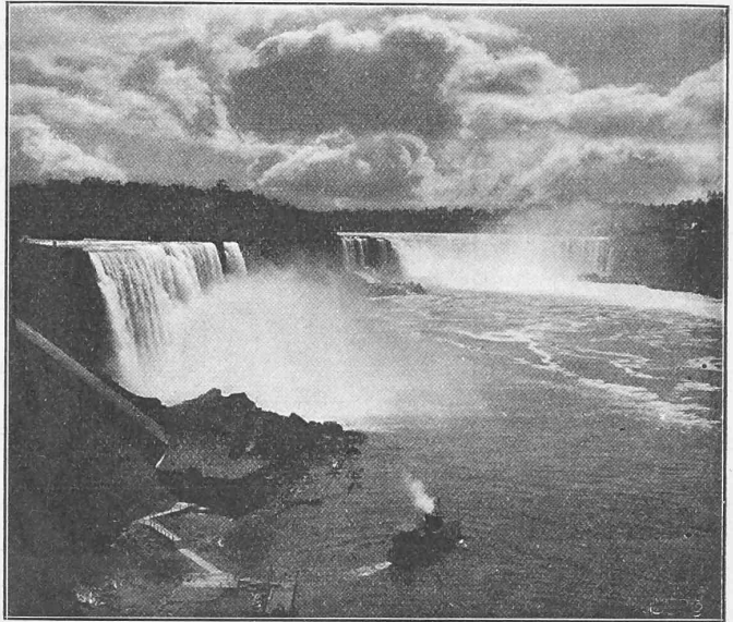
Abb. 1. Der Niagarafall vom kanadischen Ufer aus.

die alle unterhalb der Fälle liegen und nur einen Teil des Gefälles von dem aus dem Flusse, oberhalb der Fälle abgeleiteten Wasser benutzen. Erst die Niagara Falls Power Cie. schritt in ihrer bereits erwähnten Anlage zur Nutzbarmachung fast des ganzen vorhandenen Gefälles. Der Ober-